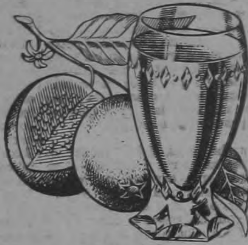
Néctar de Guayaba