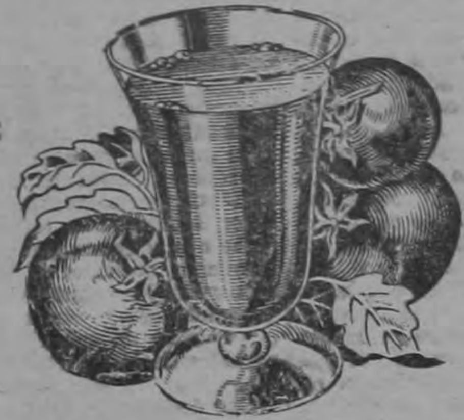
Jugo de Tomate

COMPANIA PINERA COSTARRICENSE, LTDA. TELEFONO 6318 — APARTADO 1766