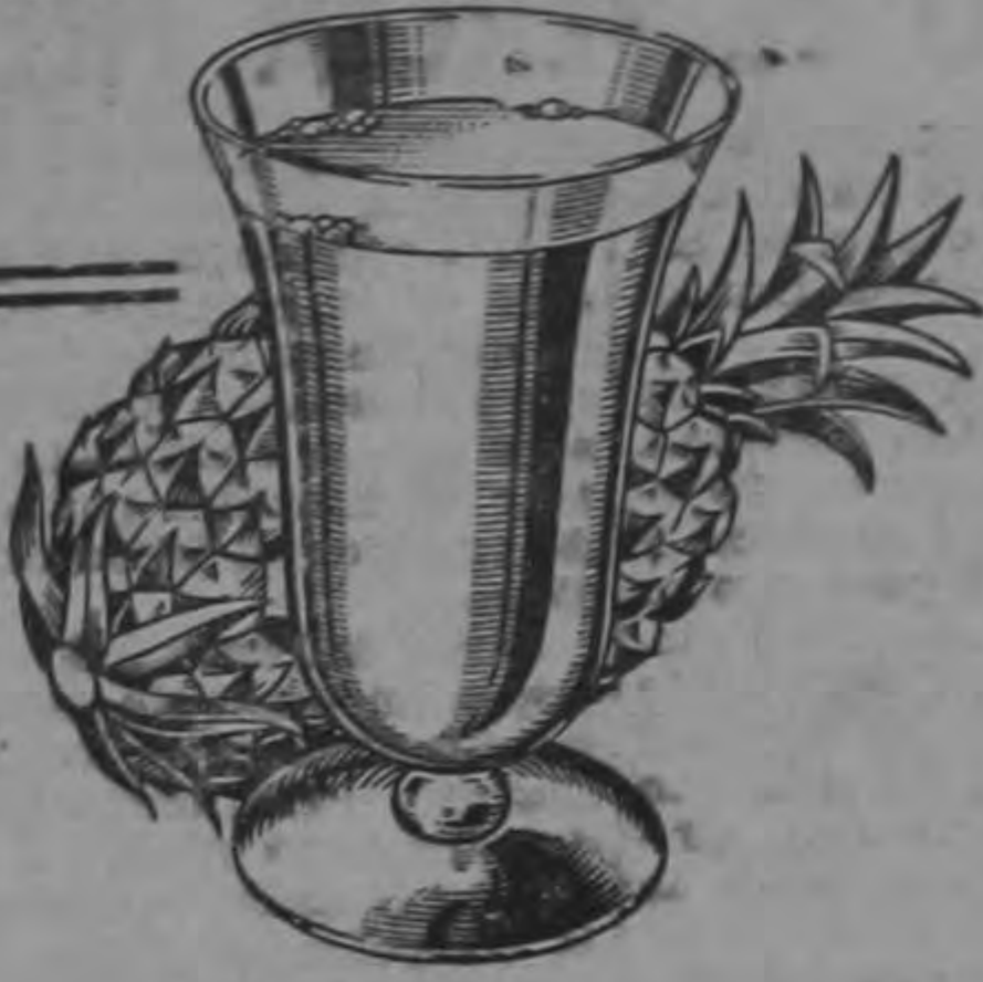
Jugo de Piña