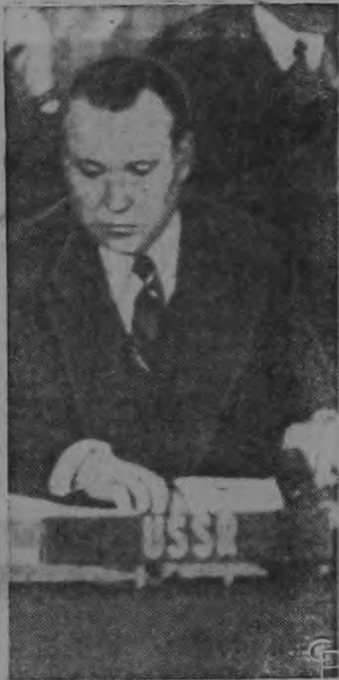
El delegado soviético a las Naciones Unidas, Jacob Malik acusa a los Estados Unidos de estar "empleando la guerra bacteriológica" en Corea.

Una espesa nube de recato envuelve totalmente los laboratorios instalados en Camp Detrick. Frede