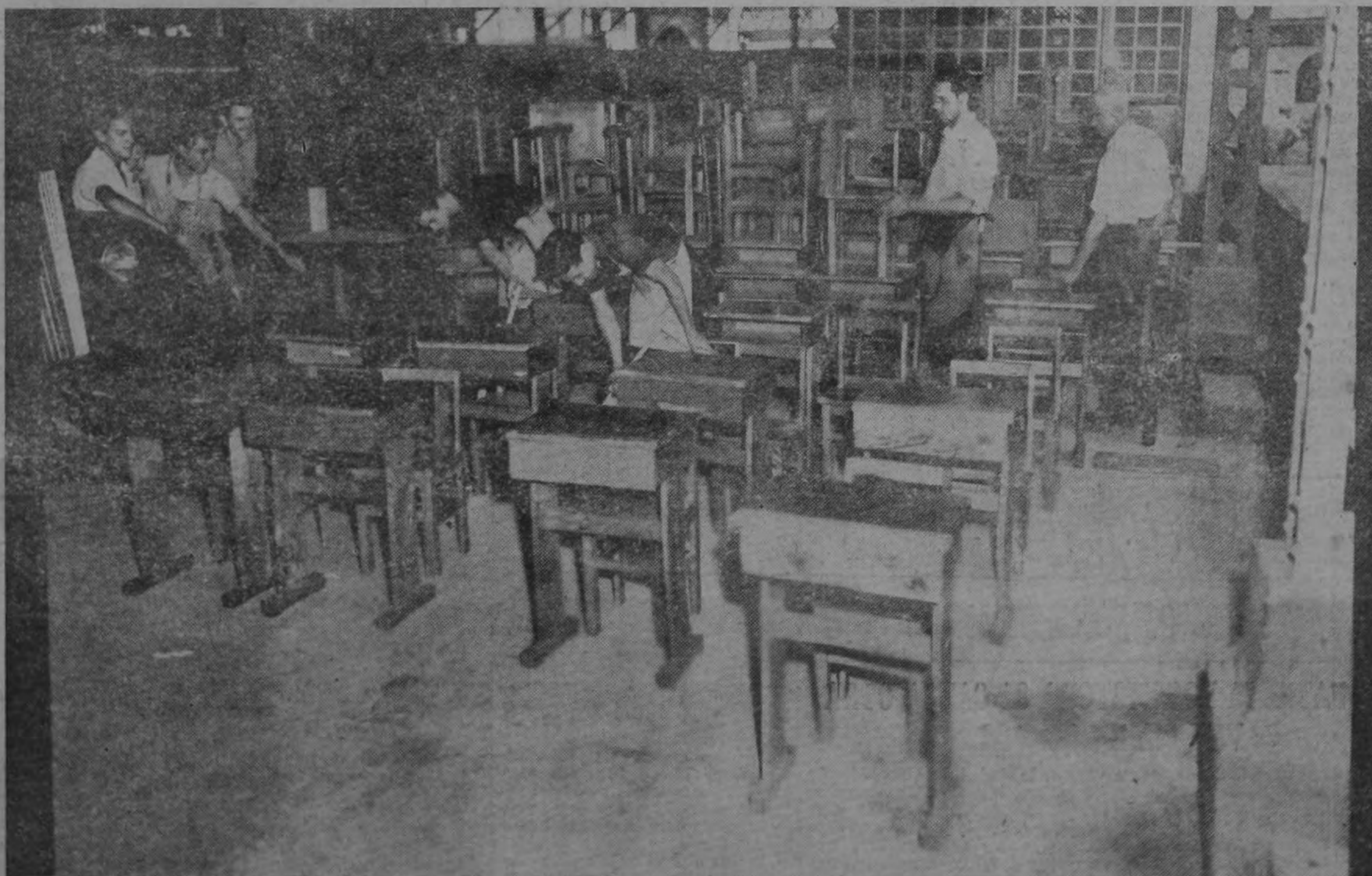
PUPITRES EN GRAN ESCALA. — En los talleres de la Penitenciaría, se ha emprendido la construcción de pupitres en gran escala, que luego el Ministerio de Obras Públicas —en consulta con el de Educación— distribuye entre las múltiples escuelas del país. El problema de la escasez de pupitres ha sido muy grave todo este tiempo, y ya está en vías de solución.— (F. Carrillo)